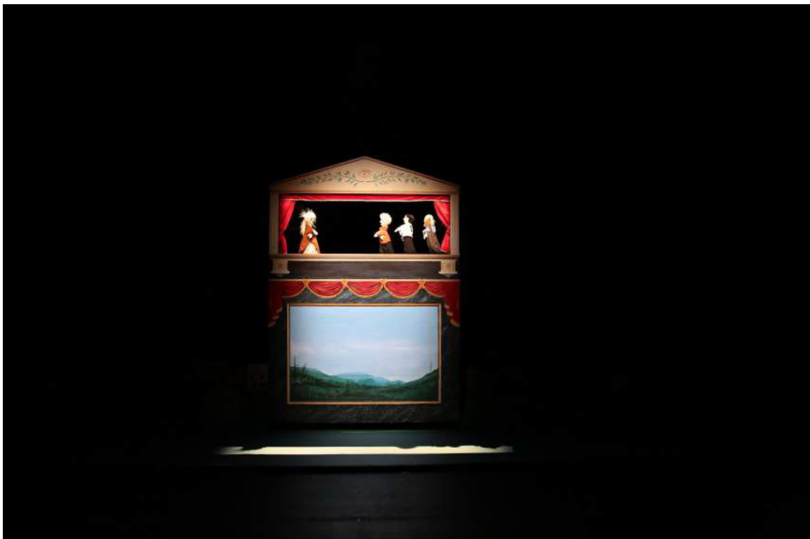
Les marionnettes à gaine