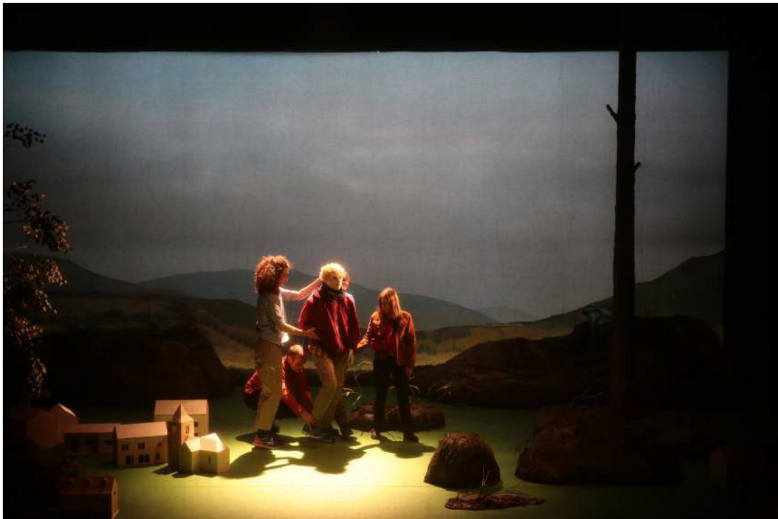
La marionnette bunraku