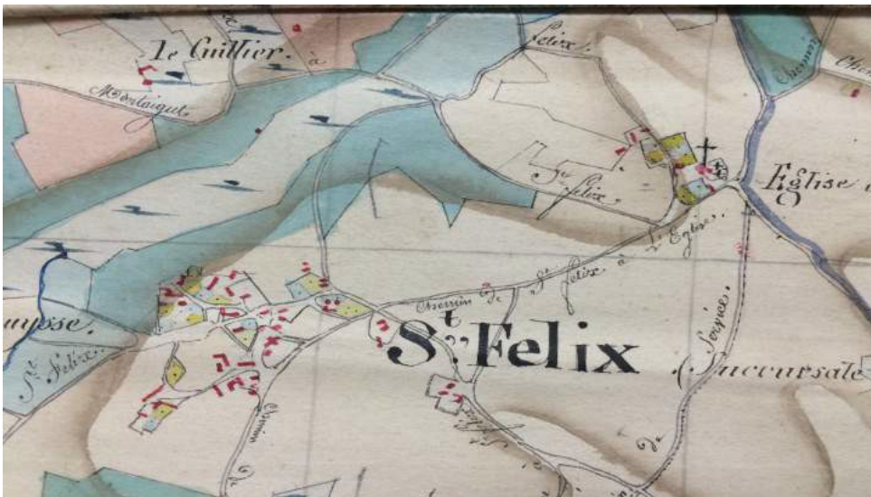
Découverte étonnante du cadastre napoléonien d'époque de Saint-Félix, dans une mairie annexe en cours de déménagement...

Dans le spectacle, nous ne situons pas le village. Une vingtaine de hameaux portent aujourd'hui le nom de Saint-Félix, en France, et nous laissons volontairement naître la confusion. C'est une manière de s'approprier les lieux autrement, de commencer à déréaliser les données objectives et de laisser à chacun le loisir de s'imaginer Saint-Félix où il l'entend.